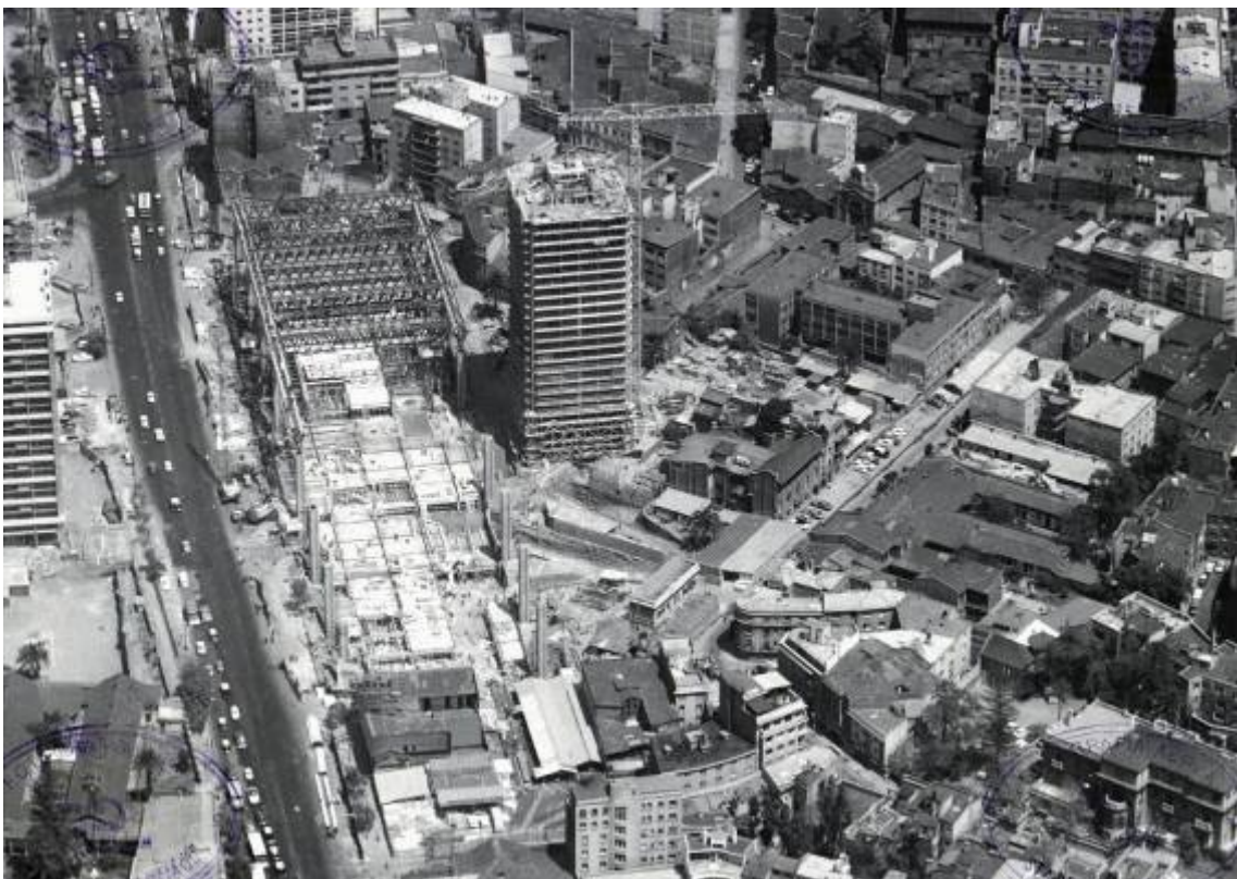
Construcción del edificio de la UNCTAD III. La violenta implantación de la geometría del polígono por sobre la trama del barrio, produjo un descalce, posible de ser remediado a través de la reestructuración y administración de su espacio público.

Esta acción, heredera del tipo de intervención planteado por la vecina Remodelación San Borja, situada frente al edificio, está también influida por el tipo de implantación urbana planteada simultáneamente en la creación del Centro Pompidou de París (Piano y Rogers, 1971). Y al igual que éste último, El Edificio de la UNCTAD III tuvo una intensa utilización como lugar de encuentro ciudadano mientras estuvo abierto.