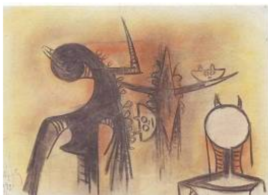
Lam, Wifredo, 1973. S/T, Colección Museo de la Solidaridad Salvador Allende.