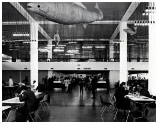
Imagen de archivo. Restaurante del Centro Cultural Metropolitano Gabriela Mistral en 1972.

el primero que, en un país del Tercer Mundo, por voluntad de los propios artistas, acerque las manifestaciones más altas de la plástica contemporánea, a las grandes masas populares. " 2